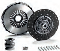
■ Originální sada spojky MAN ecoline

Zajistěte si špičkovou kvalitu za špičkovou cenu – protože nic není lepší než originál.