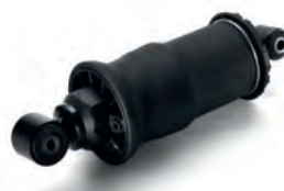
■ Originální vzduchové pružiny MAN