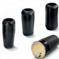
■ Originální měchy vzduchových pružin MAN