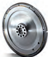
■ Originální setrvačníky MAN