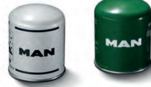
■ Originální kartuše vysoušečů vzduchu MAN