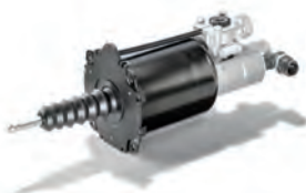
■ Originální hlavní spojkové válce MAN