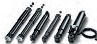
■ Originální tlumiče nárazů MAN