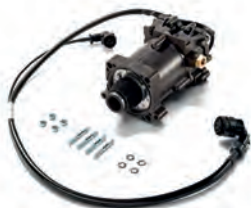
■ Originální hlavní spojkové válce MAN